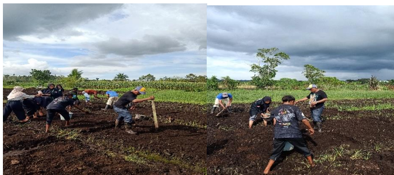
Gambar 7. Aksi penanaman bibit jagung disetiap lubang tanam

Seluruh rangkaian teknis ini diakhiri dengan proses penanaman benih secara kolektif untuk menjamin penerapan standar budidaya yang presisi (Gambar 7a & 7b). Menanam jagung dengan jarak yang seragam memastikan populasi tanaman jagung tersebar secara merata, memberikan lebih banyak ruang tumbuh (air, nutrisi, dan jarak antar ruas) dan sinar matahari yang lebih seimbang untuk setiap tanaman. Dengan jarak tanam yang tepat, fotosintesis dapat berlangsung dengan baik karena dedaunan tidak terlalu lebat (Wachid & Lesmana, 2020). Oleh karena itu, pengaturan pola tanam yang tepat merupakan kunci untuk meningkatkan efisiensi lahan dan produktivitas tanaman jagung secara menyeluruh.