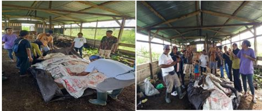
Gambar 5. Tahap akhir kegiatan fermentasi & pemeraman