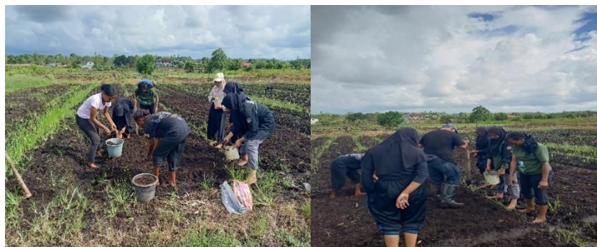
Gambar 6. Aplikasi pupuk pada masing masing lubang tanam

Seluruh rangkaian teknis ini diakhiri dengan proses penanaman benih secara kolektif untuk menjamin penerapan standar budidaya yang presisi (Gambar 7a & 7b). Menanam jagung dengan jarak yang seragam memastikan populasi tanaman jagung tersebar secara merata, memberikan lebih banyak ruang tumbuh (air, nutrisi, dan jarak antar ruas) dan sinar matahari yang lebih seimbang untuk setiap tanaman. Dengan jarak tanam yang tepat, fotosintesis dapat berlangsung dengan baik karena dedaunan tidak terlalu lebat (Wachid & Lesmana, 2020). Oleh karena itu, pengaturan pola tanam yang tepat merupakan kunci untuk meningkatkan efisiensi lahan dan produktivitas tanaman jagung secara menyeluruh.