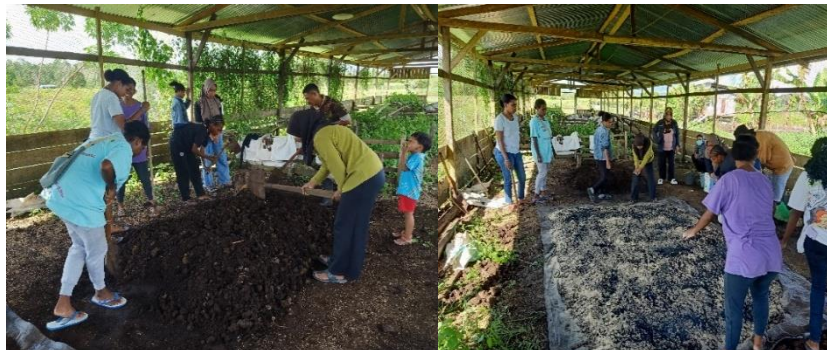
Gambar 4. Pengadukan bahan padat kohe sapi dan Pengadukan kohe sapi dengan dedak