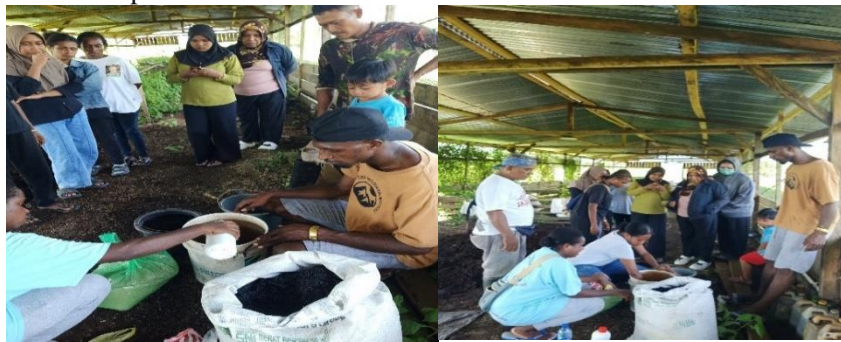
Gambar 3. Aktivasi mikroba menggunakan larutan gula sebagai sumber energy

Pupuk yang telah matang tersebut kemudian diaplikasikan langsung pada setiap lubang tanam di lahan demplot jagung manis sebagai basis nutrisi awal (Gambar 6a & 6b). Menurut Ginting et al., (2021).Metode aplikasi pupuk pada pemberian pupuk ke dalam lubang tanam, dianggap lebih efektif dalam penyerapan nutrisi dibandingkan dengan pemberian secara merata, terutama selama fase pertumbuhan vegetatif awal. Ini karena metode ini menempatkan nutrisi di zona akar dan mengurangi kehilangan nutrisi karena pencucian dan fiksasi tanah.