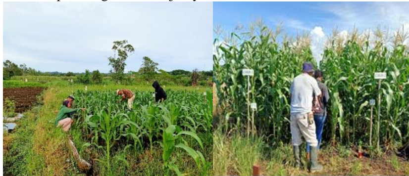
Gambar 8. Pengamatan pertumbuhan tanaman umur 2 MST & 6 MST menjelang Panen

menyeluruh terhadap pelaksanaan program secara periodik seperti pada Gambar 8a & 8b. Monitoring dilaksanakan secara partisipatif melibatkan mahasiswa dan petani, sehingga mendorong rasa memiliki terhadap inovasi yang diadopsi. Tahap ini juga mengidentifikasi kendala teknis di lapangan untuk menjadi dasar perbaikan pada kegiatan selanjutnya