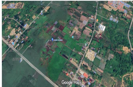
Gambar 1. Lokasi Pengabdian Kepada Masyarakat