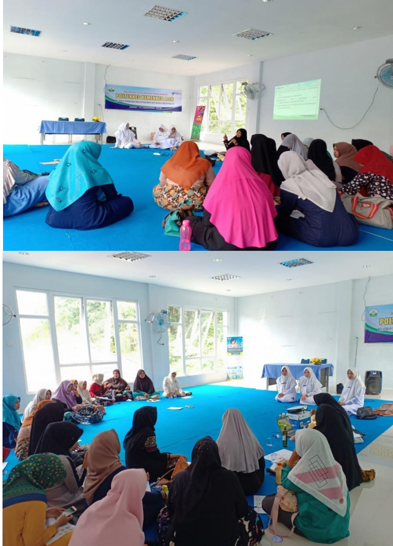
Gambar 2. Edukasi self management diabetes mellitus tipe 2

Edukasi kepada masyarakat akan dengan mudah dilakukan apabila danya peran serta dari berbagai pihak dalam membantu memberikan edukasi kepada masyarakat terutama masyarakat yang sudah menderita Diabetes mellitus tipe 2.