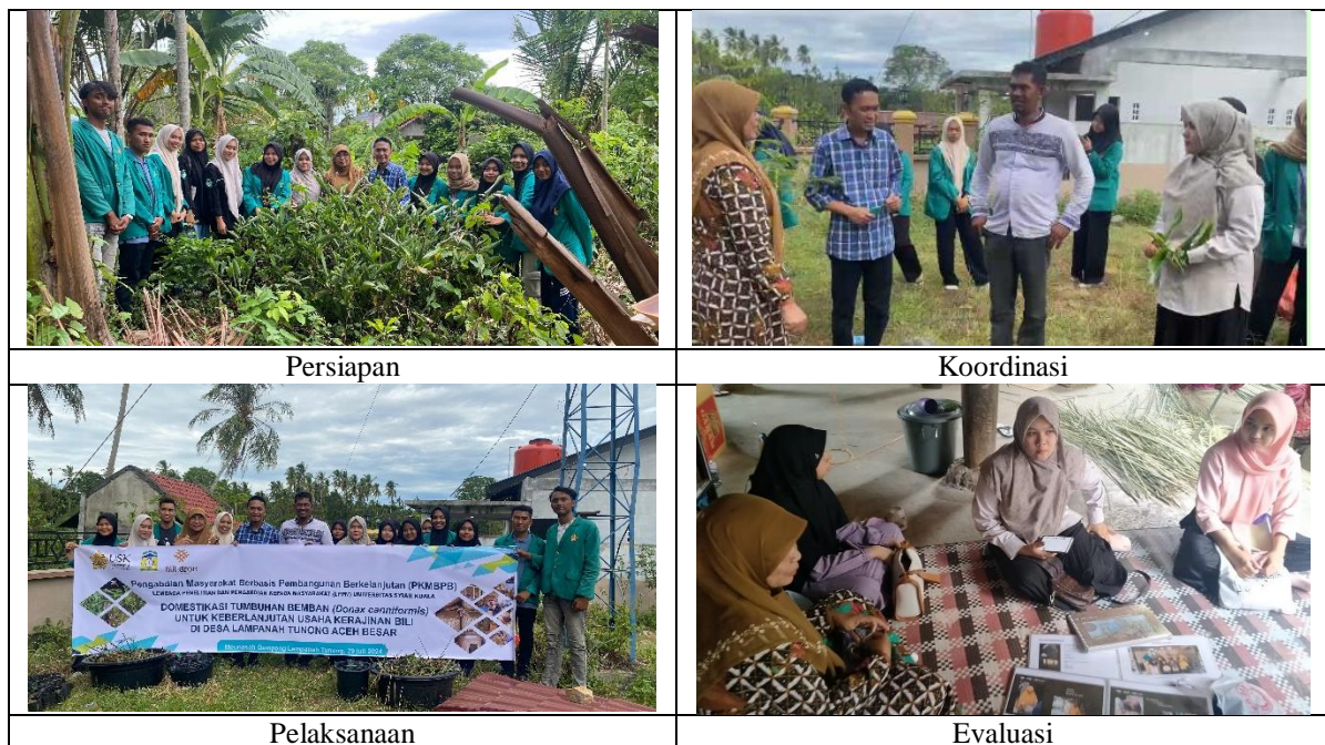
Gambar 3. Tahapan kegiatan yang dijalankan

Tahapan kegiatan yang dilakukan dalam kegiatan pengabdian ini adalah meliputi tahap persiapan, koordinasi, pelaksanaan dan evaluasi. Kegiatan pada tahap persiapan meliputi proses identifikasi dan inventarisasi masalah yang dihadapi pengrajin. Permasalahan yang teridentifikasi dan terinventarisir tersebut dianalisa untuk menemukan dan merumuskan solusi yang akan dijalankan dalam bentuk program kerja pengabdian.