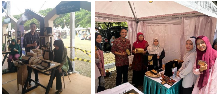
Gambar 5. Partisipasi di beberapa kegiatan expo

langsung. Kulit kering inilah yang dianyam menjadi produk setengah jadi atau produk jadi. Biasanya untuk produk setengah jadi memerlukan perlakuan tambahan yaitu penjahitan. Proses ini bertujuan untuk penyempurnaan produk atau pengkombinasian dengan bahan tambahan seperti kain, kertas, kulit atau kulit sintetis.