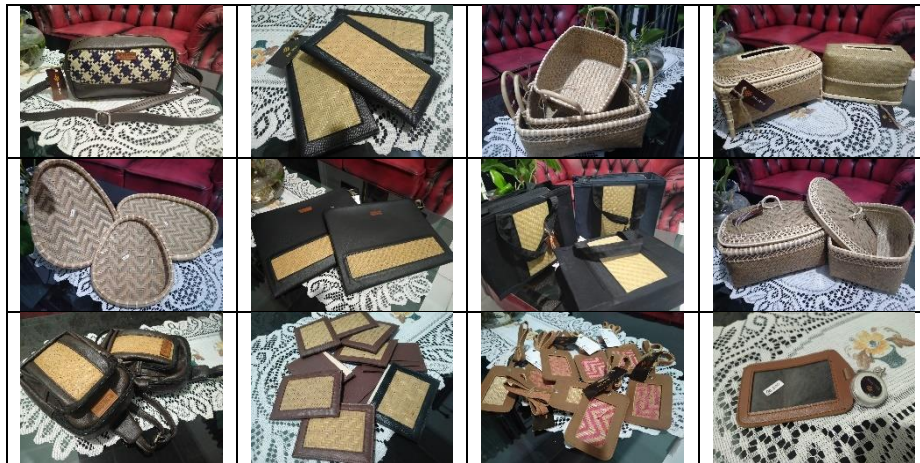
Gambar 4. Aneka hasil kerajinan anyaman bambu mitra

Diantara jenis produk yang dihasilkan oleh kelompok mitra binaan melalui pemanfaatan tumbuhan bambu ini adalah berupa produk fashion , home décor , dan corporate souvenir . Produk berbasis fashion antara lain seperti: tas, dompet, dan asesoris. Produk berbasis home décor yang telah dihasilkan adalah berupa pas bunga, kotak tisu, dan tempat buah. Sedangkan corporate souvenir adalah badge nama, plakat, dan seminar kit. Produk-produk yang telah dihasilkan oleh para pengrajin tersebut telah menjadi icon dan produk kerajinan unggulan bagi Kabupaten Aceh Besar.