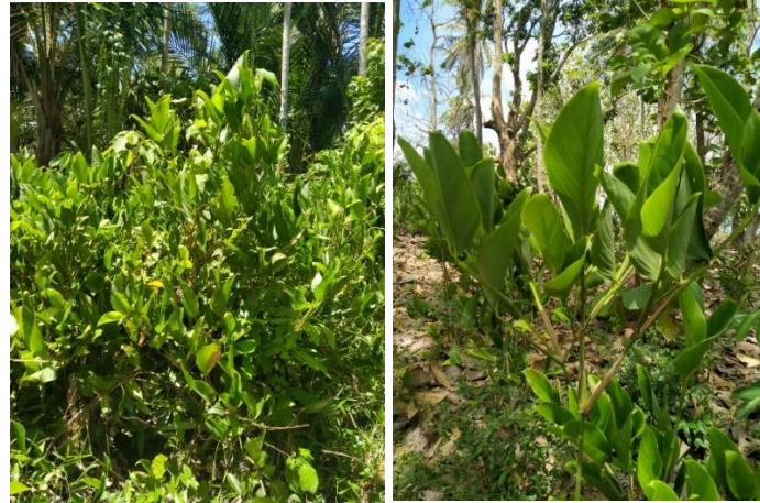
Gambar 1. Bemban yang tumbuh liar di lahan warga

komposit. Berdasarkan kajian Yoga, Dkk (2023), komposit serat bemban memiliki ketahanan paling baik dibandingkan serat lain.