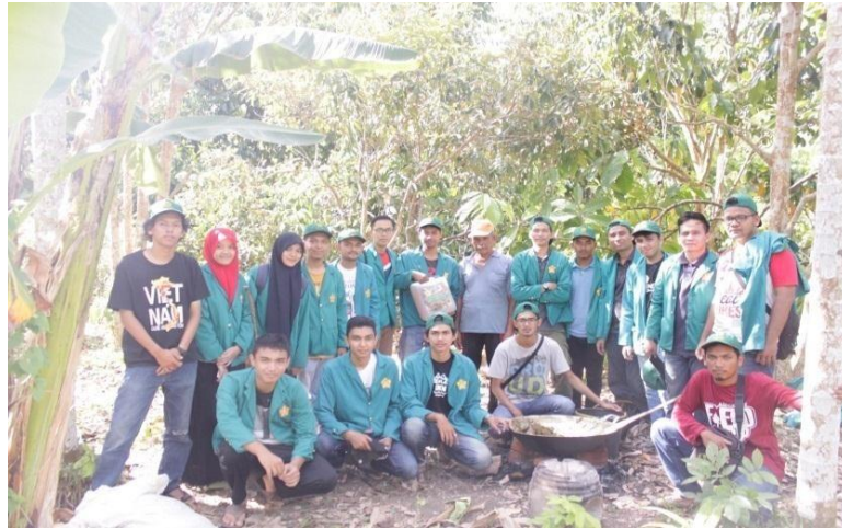
Gambar 6. Penyerahan Pestisida Nabati Kepada Petani