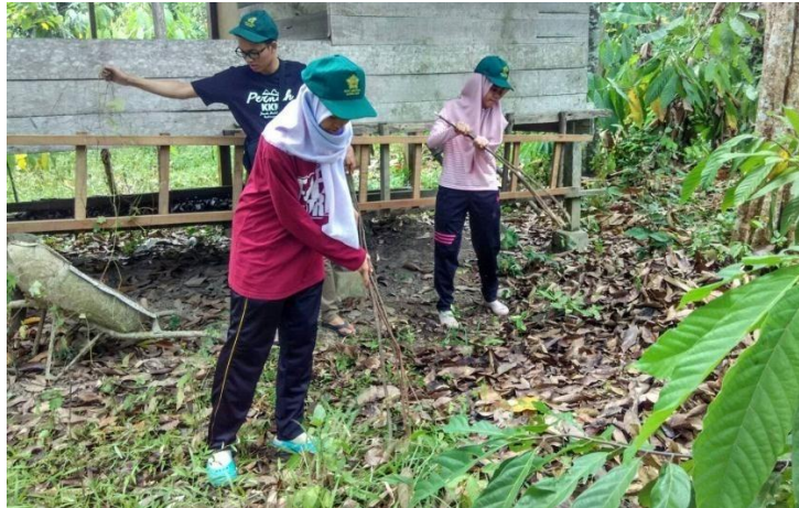
Gambar 9. Sanitasi Kebun Kakao