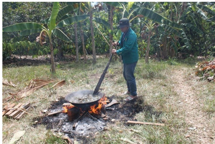
Gambar 4. Pembuatan Pestisida Nabati