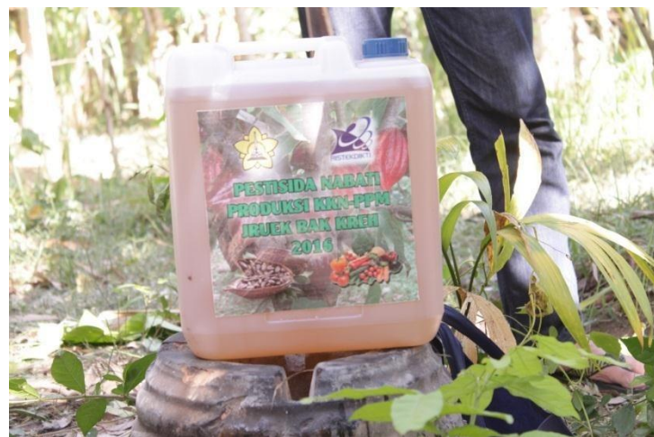
Gambar 5. Pengemasan Pestisida Nabati