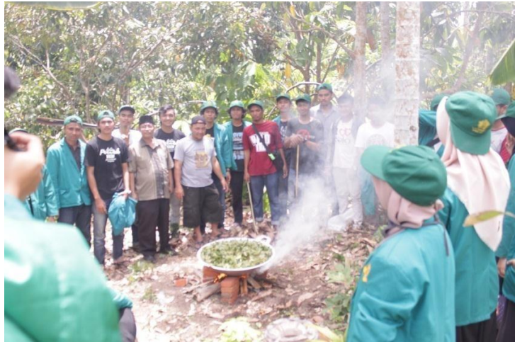
Gambar 3. Pembuatan Pestisida Nabati