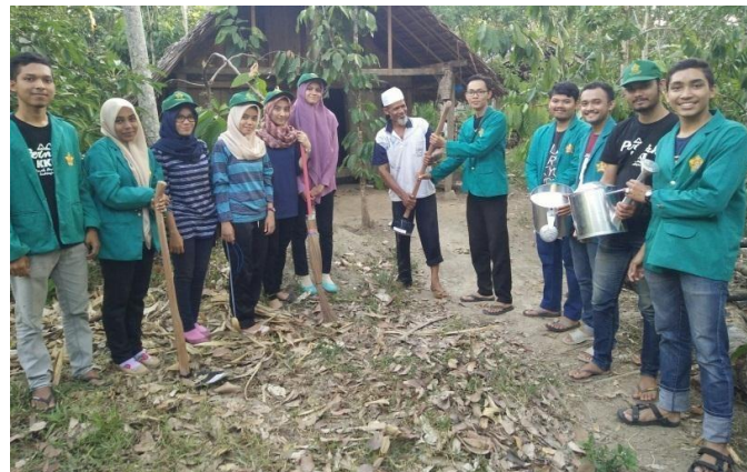
Gambar 8. Penyerahan Alat Kebun kepada Petani Kakao