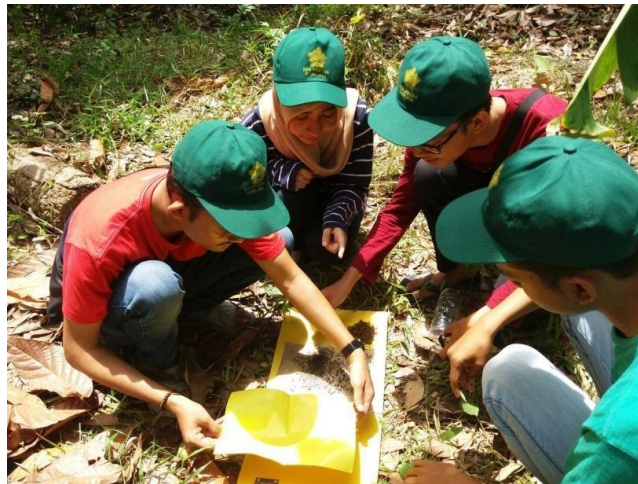
Gambar 7. Pemeliharaan rumah hama PBK