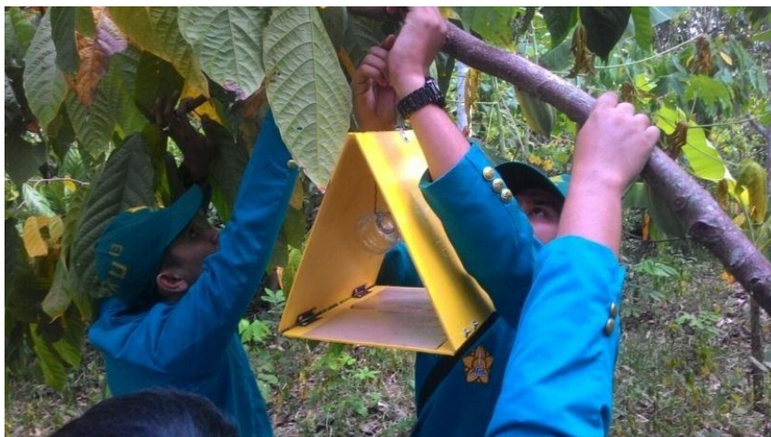
Gambar 2. Pemasangan Rumah Hama PBK