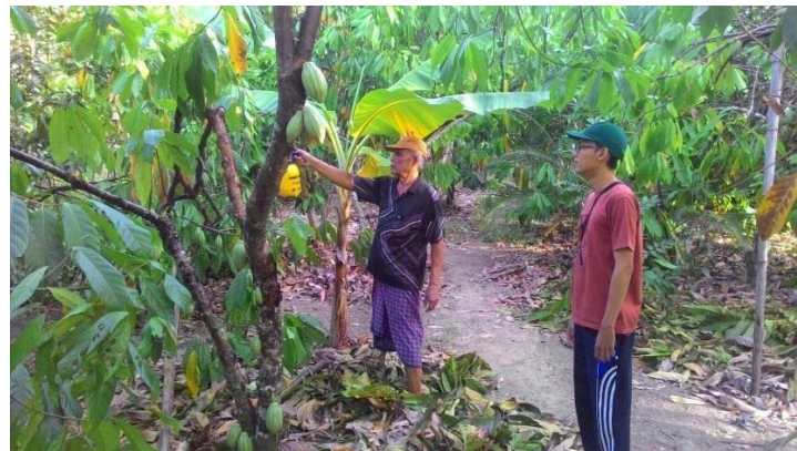
Gambar 10. Penyemprotan Pestisida Nabati