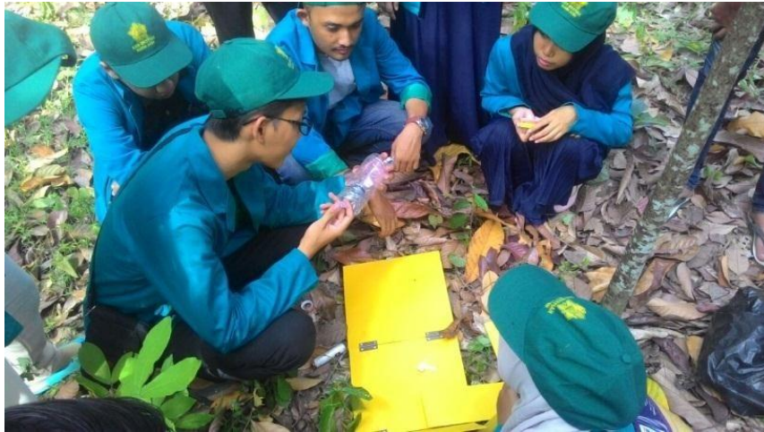
Gambar 1. Penyuntikan Feromon

Dari kegiatan ini petani dapat menumbuhkan pengetahuan petani mengenai pengendalian hama penggerek buah kakao dengan cara mudah dan murah namun hasilnya nyata, dan juga petani dapat membuat pestisida nabati dengan bahan yang tumbuh disekitarnya serta dapat menambah income bagi petani yang mau menjadikan pestisida nabati sebagai sumber usaha dan sumber pendapatan. Pemerintah Daerah Aceh Besar dapat menjadikan model pembinaan untuk daerah lain dan dijadikan sebagai model pengembangan kakao secara berkesinambungan. Selain itu pihak perbankan dapat mengucurkan kredit/modal untuk usaha kelompok tani yang terbentuk. Pemberian modal usaha tersebut akan memudahkan kelompok tani dalam mengembangkan dan meningkatkan produksi kakao. Peningkatan produksi kakao berkonsekuensi terbukanya peluang pasar dan petani akan sejahtera.