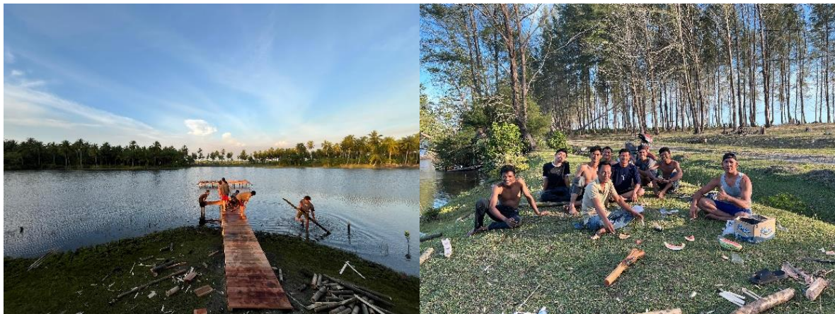
Gambar 4. Pembangunan Infrastruktur Pendukung Pariwisata

Pemuda Desa Kuala Trang diharap dapat mengembangkan keterampilan manajerial dan kepemimpinan dalam pengelolaan kawasan wisata setelah proses diskusi dan pendampingan. Kegiatan ini diharap dapat menambah keahlian kelompok dalam merencanakan, memasarkan, dan mengelola sumber daya alam secara berkelanjutan. Tindak lanjut dari diskusi dan pembentukan kelompok pengelola wisata ialah pembuatan infrastruktur yang mendukung pariwisata di Desa Kuala Trang (Gambar 4). Infrastruktur yang dikembangkan diharap dapat menarik minat wisatawan dan mendukung pembentukan desa wisata. Infrastruktur pariwisata sebagai bagian tambahan yang menarik wisatawan bukan hanya memberikan pengalaman langsung untuk mengelola destinasi wisata secara profesional, tetapi juga menuntun kelompok pengelola menjadi agen perubahan sektor pariwisata. Baik pemasaran dan pengelolaan infrastruktur diharap mampu memberikan peningkatan pendapatan bagi masyarakat lokal melalui sektor pariwisata, menciptakan lapangan pekerjaan baru di sektor jasa, kuliner, dan kerajinan lokal, serta memberdayakan ekonomi desa sekitar. Pendampingan lebih lanjut dilakukan dalam bentuk pemberian wawasan terkait teknologi digital dalam pengembangan desa wisata.