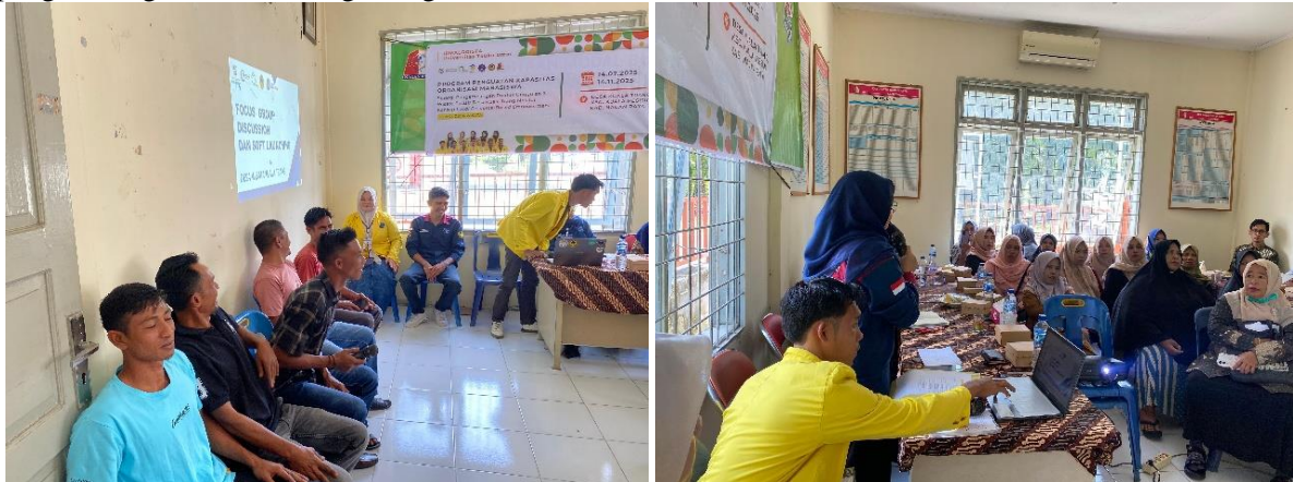
Gambar 2. Focus Group Discussion (FGD)

Setelah terbentuk kelompok pengelola, Focus Group Discussion (FGD) dilakukan oleh para pemuda yang tergabung dalam kelompok pengawas dan pengelola kawasan wisata pantai dan kolam bebek Desa Kuala Trang, bersama dengan masyarakat, perangkat desa, serta perwakilan dari pemerintah Kabupaten Nagan Raya (Gambar 2). Tahap pendampingan dilakukan untuk memberi arahan agar kelompok pengelola dapat menjadi kelompok mandiri yang dapat melanjutkan pengembangan Kuala Trang sebagai desa wisata.