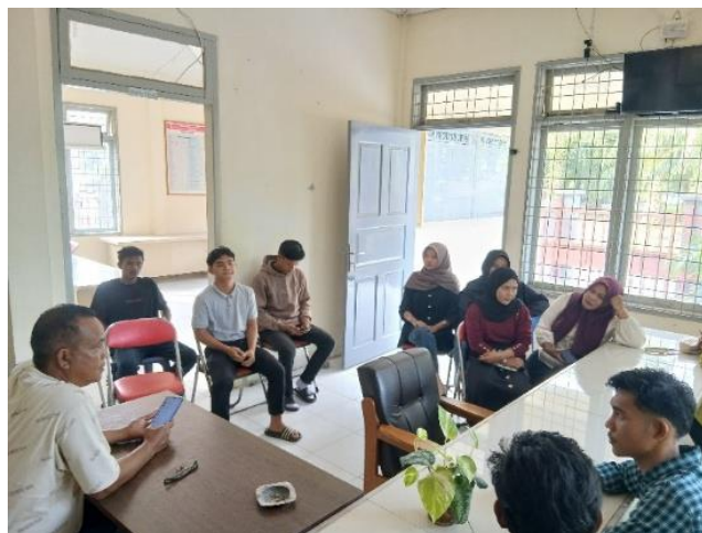
Gambar 1. Diskusi dan Inisiasi dengan Perangkat Desa

Realisasi kegiatan pengabdian masyarakat ini dilakukan di Desa Kuala Trang, Kabupaten Nagan Raya, Aceh. Waktu pelaksanaan pengabdian masyarakat dilakukan di bulan Agustus hingga September 2025. Pelaksanaan kegiatan dilakukan dalam beberapa tahap, yaitu tahap inisiasi, tahap pembentukan kelompok pengelola, tahap Focus Group Discussion (FGD), serta tahap pendampingan. Tahap inisiasi dalam pembentukan kelompok ini dimulai dengan diskusi dan pendekatan melalui perangkat desa, khususnya Kepala Desa ( Keuchik ) serta para pemuda di Desa Kuala Trang untuk memahami kondisi masyarakat dan potensi wisata desa (Gambar 1). Selanjutnya, dilakukan inisiasi lanjutan agar perangkat desa mulai melakukan pembentukan kelompok pengelola wisata desa yang berasal dari pemuda desa. Tujuan pembentukan kelompok ini ialah agar potensi wisata di Desa Kuala Trang dapat dikelola dengan baik, sehingga nantinya Desa Kuala Trang dapat menjadi desa wisata yang mandiri.